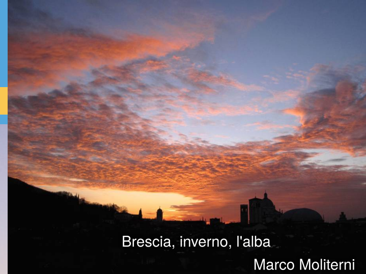
Brescia, inverno, l'alba